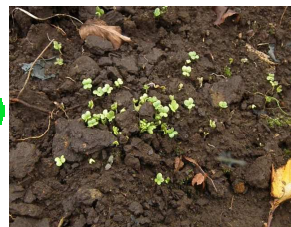
芽を出したナノハナ

「府中崖線西府町緑地」に10月18日、ナノハナとショカツサイ(ハナダイコン)を植えました。1週間後の24日には芽を出していました。来春には咲くでしょう。