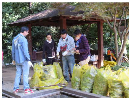
あずまやでゴミを分別する KSKの皆さま

10月18日(土)に第7回清掃活動が行われました。秋晴れのなか、清掃活動時間が10時～11時30分、意見交換が11時30分～11時50分まで行われました。参加者総数は29人です。