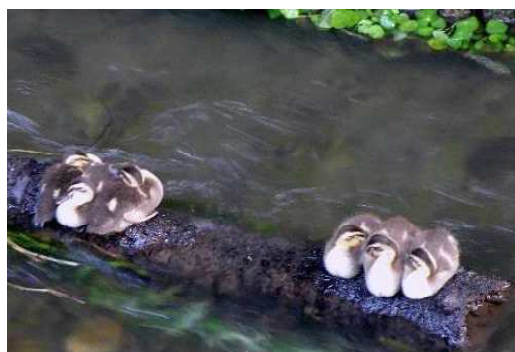
19 カルガモの赤ちゃん