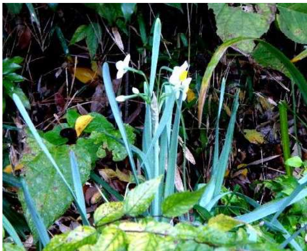
ハケに咲く花シリーズ 4

スイセン(水仙)。ヒガンバナ科の多年草。原産地は地中海沿岸で、花期は12月~4月。日本では暖地の海岸近くで、野生化したニホンスイセンなどが見られる。園芸品種が多い