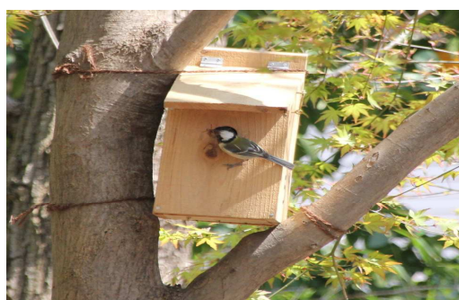
21 ハケに取付けた巣箱に入るシジュウカラ