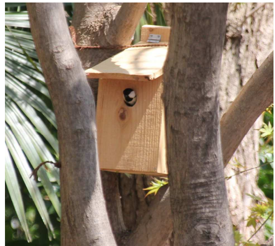
シジウカラ 当会が取付けた本宿町緑地の巣箱に入る