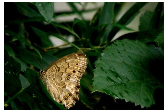
28 サトキマダラヒカゲ