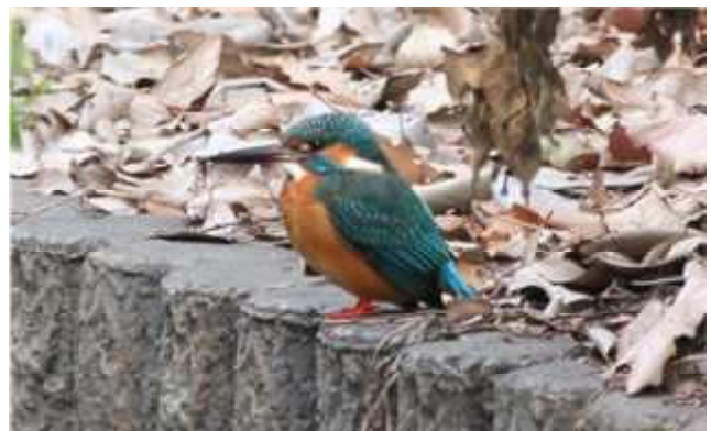
カワセミ わき水周辺の市川用水で撮影

スイセン(水仙)。ヒガンバナ科の多年草。原産地は地中海沿岸で、花期は12月~4月。日本では暖地の海岸近くで、野生化したニホンスイセンなどが見られる。園芸品種が多い