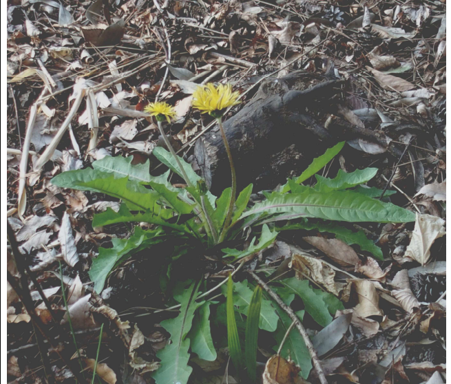
ハケに咲く花シリーズ5