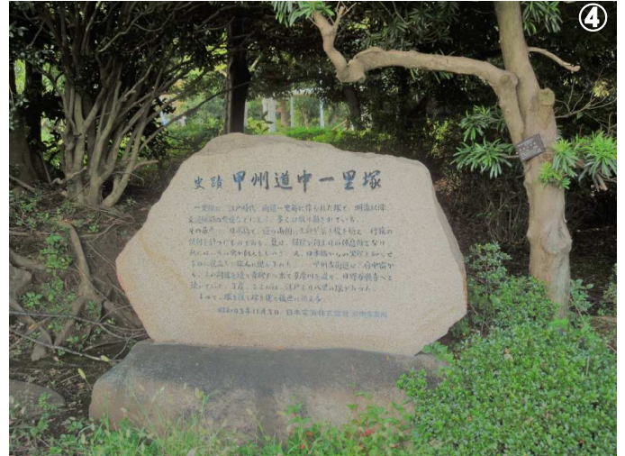
⑤写真は2面ルート図の説明地点 ④甲州道中一里塚跡／(株)NEC府中事業所内