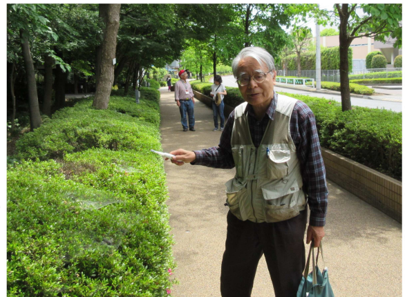
西府崖線にて昆虫の生態系調査中