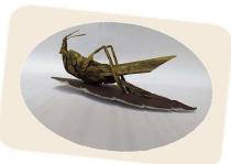
鈴木名人作成バッタ