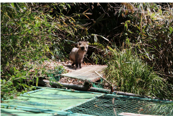
西府崖線に現れたタヌキ

☆多摩丘陵から緑地帯を伝ってやってきたと思われる。写真提供/牧原文男(2019年4月3日撮影)