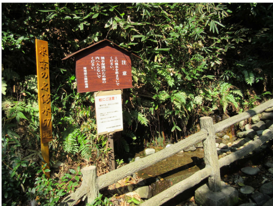
東京の名湧水57選の西府町湧水