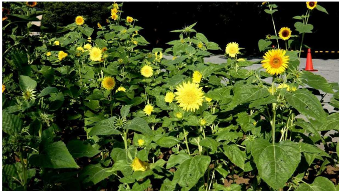
ヒマワリ/西府町緑地花壇

市民花壇は府中市から頂く花の苗を植えつけ管理するのみですが、西府町緑地は花の種まきから行っています。関わり始めてから3年が経ちますが菜の花、ヒマワリ、コスモスと広い花壇一面に咲かすための水の管理、肥料、草抜きと作業を続けています。