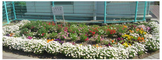
スノーボール、パンジー、ナデシコ/市民花壇