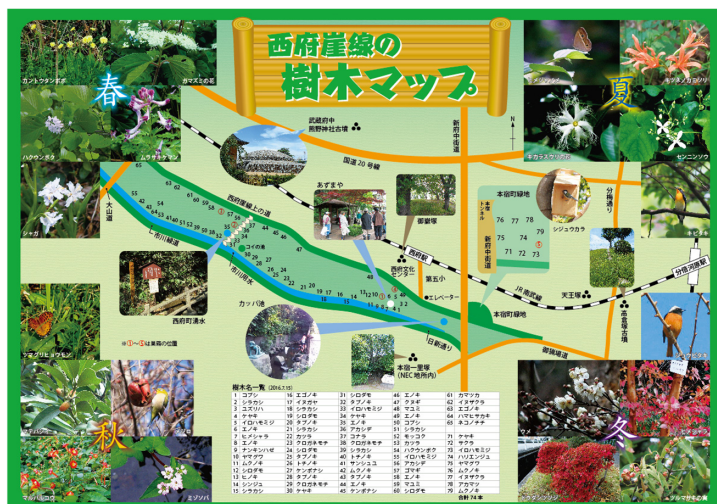
ハケマップ中面(A3サイズ)

作業終了後、速やかに2016年9月1日発行のA3サイズ三つ折り『ハケって、なに? (通称:ハケマップ)』の改訂版を作成いたします。写真は現在の『ハケマップ』中面です。