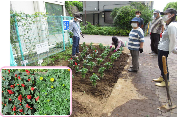
作業が一段落し、一息いれるメンバー。 ◎はサルビア(左)とマリーゴールドの苗

花芽を沢山つけた根の張ったよい苗です。花好きの会員等8人とともに土を耕し、肥料を施し見栄えよい植え付けができました。当花壇の近くには用水が通っているため、花の水やり等の心配はなくラッキーな面がある花壇です。作業日時は6月28日(月)9:00~10:45、天候は曇りのち晴でした。