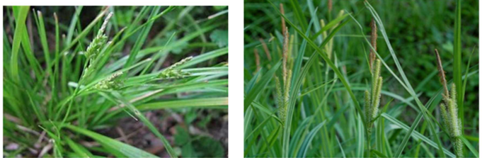
ヤブマオ(信号機付近南斜面)