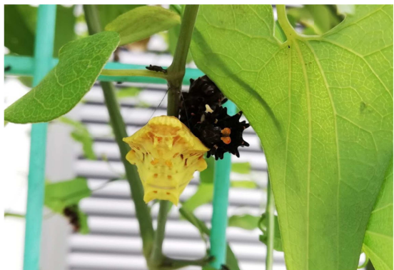
↓幼虫と夏のサナギ(黄色) = 2021年7月16日撮影

★ ツバキ等の剪定講習会 3月30日(水) 9:00~11:00 集合場所/日新町エレベーター下の市民花壇前 集合時間/9:00 講師/仁平豊彦