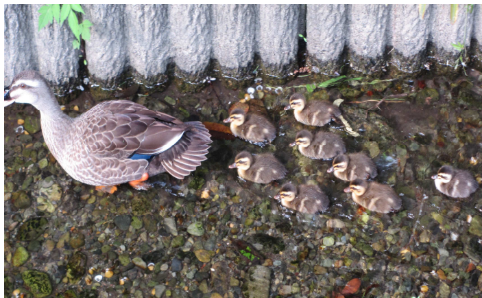
カルガモ親子のお通りです/市川用水にて

NPO法人・府中かんきょう市民の会 発行/平成25年6月10日(月) No.8 担当/葛西 利武 ☎090-5564-5838 ホームページ http://f-env.sakura.ne.jp 「府中市環境保全活動センター」サポーター登録団体