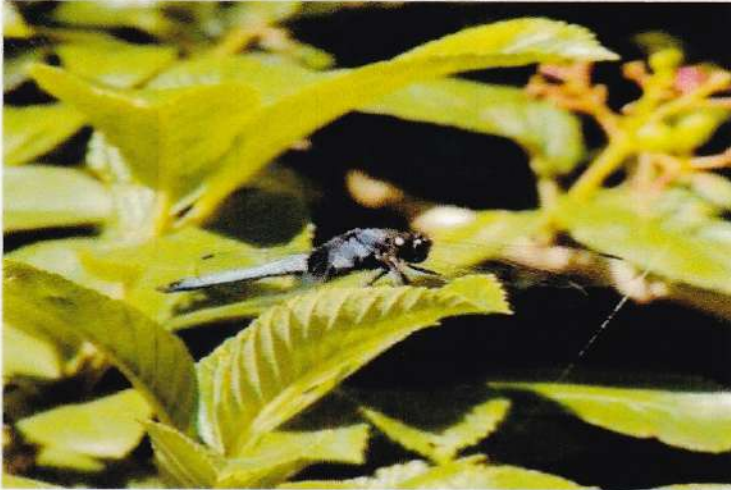
31 オオシオカラトンボ