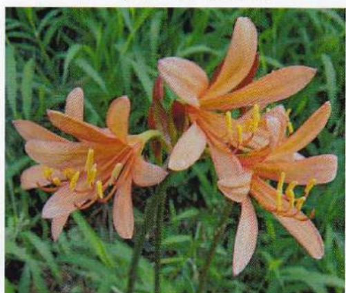
10 キツネノカミソリ