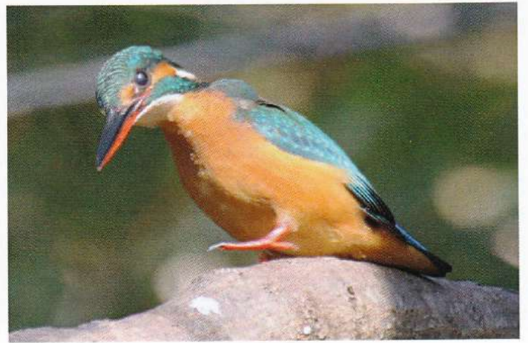
22 片足上げカワセミ