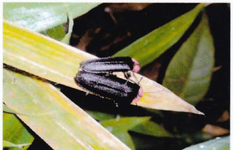
34 ゲンジボタルの交尾