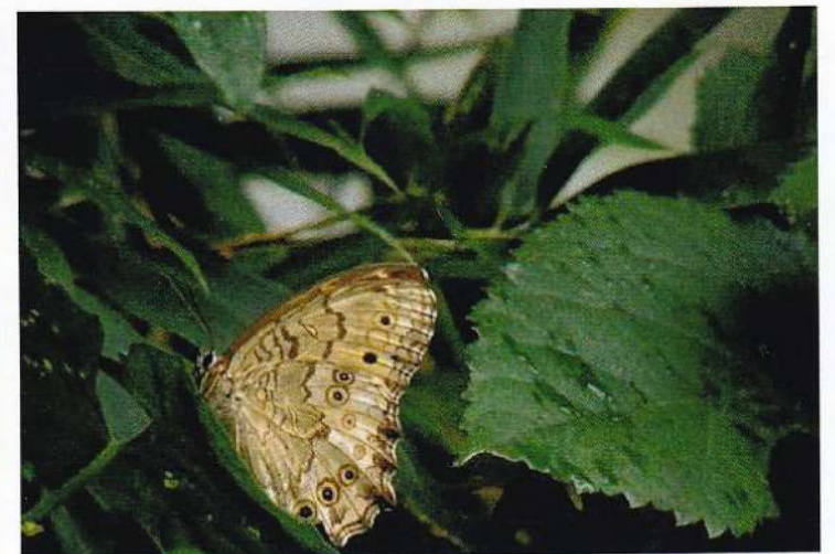
28 サトキマダラヒカゲ