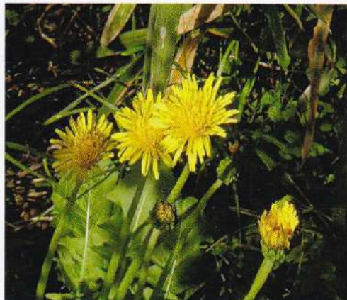
2 カントウタンポポ